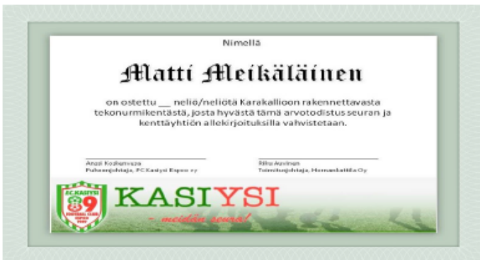
Aava-kentän neliön ostaneet saavat komean sertifikaatin.

Neliön hinta on 100 euroa, ja se menee kokonaisuudessaan kentän pinnoitteen maksamiseen. Neliöitä on myynnissä yhteen 6161 kappaletta, joten ne eivät hetkessä loppu! Useammankin neliön voi ostaa. Kentän omistajaksi pääsee maksamalla neliöiden hinnan Kasiysin tilille FI9822131800017847. Kirjoita viestikenttään Neliö Aava-kentästä ja nimesi.