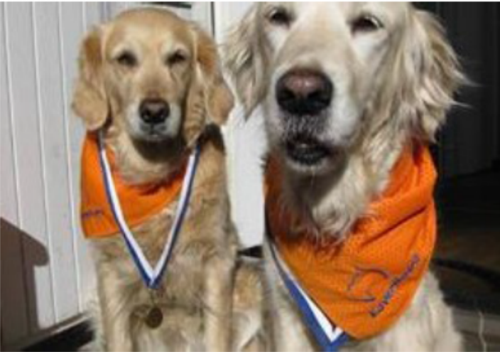
Kennelliiton kaverikoirat tunnustetaan työasustaan eli oranssista huivista ja koiranomistajan samanvärisestä rintanapista.

Kaverikoiratoiminta alkoi Suomessa vuonna 2001. Tällä hetkellä toiminnassa on mukana jo lähes 1000 koirakkoa eri puolilta Suomea.